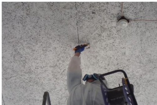
≪試料採取状況(木毛セメント板/色セメント吹付)≫