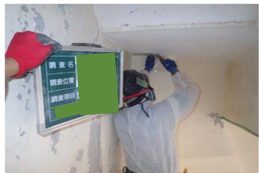
≪試料採取状況(コンクリート打放し/色セメント吹付)≫