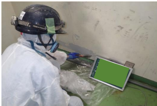
≪試料採取状況(モルタル金ごて押え/VP3 回塗り)≫